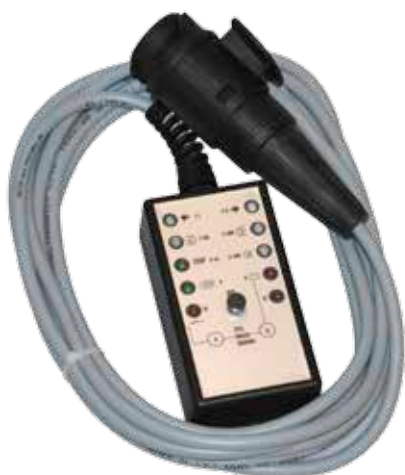
Adapter 13-7 pol

Leveres standard med 13 pol støpsel. Adapter til 7 pol leveres som ekstrautstyr (LAS-524900). Testeren er meget enkel i bruk. Kan brukes på biler med og uten Can Bus systemer. Kabellengde: 5 meter.