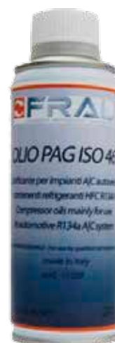
FRA-110290YF PAG 46