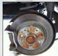
Skive FØR dreieing