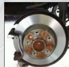
Skive ETTER dreieing